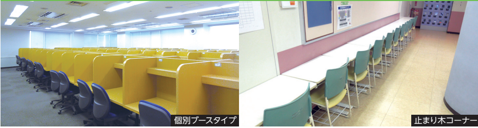
個別ブースタイプ