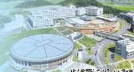
九州大学伊都キャンパス